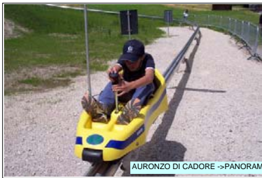
AURONZO DI CADORE -> PANORAMA