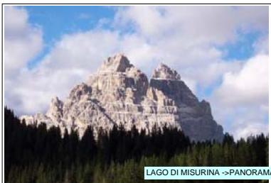
LAGO DI MISURINA -> PANORAMA