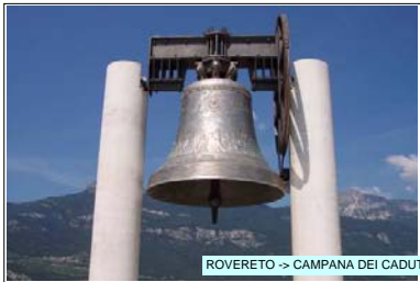
ROVERETO -> CAMPANA DEI CADUTI