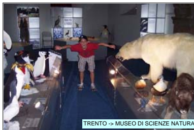
TRENTO -> MUSEO DI SCIENZE NATURALI