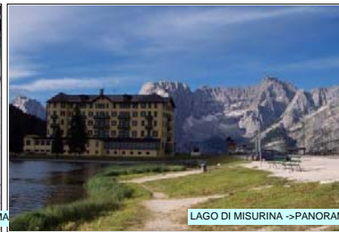
LAGO DI MISURINA -> PANORAMA