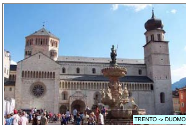
TRENTO -> DUOMO