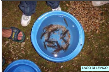
LAGO DI LEVICO