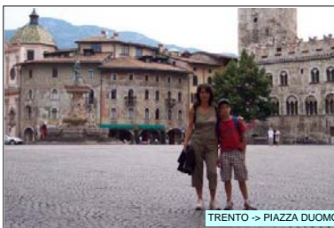
TRENTO -> PIAZZA DUOMO