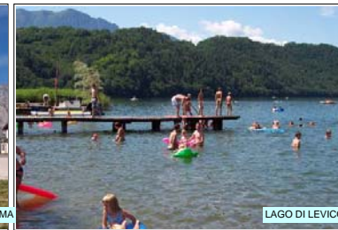
LAGO DI LEVICO