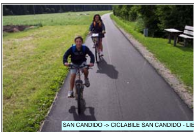
SAN CANDIDO -> CICLABILE SAN CANDIDO - LIEN