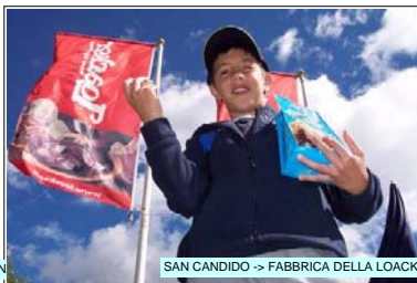
SAN CANDIDO -> FABBRICA DELLA LOACKER