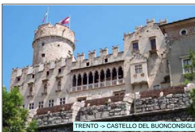
TRENTO -> CASTELLO DEL BUONCONSIGLIO