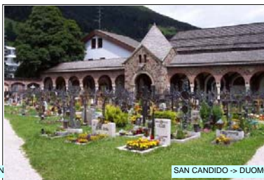
SAN CANDIDO -> DUOMO