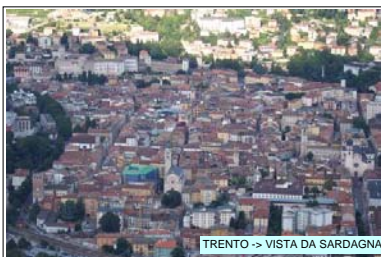
TRENTO -> VISTA DA SARDAGNA