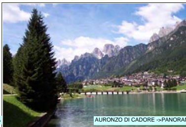
AURONZO DI CADORE -> PANORAMA