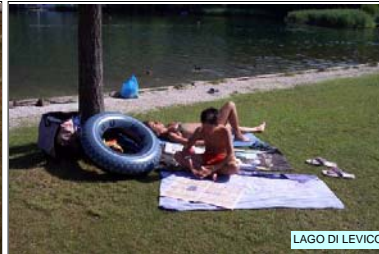
LAGO DI LEVICO