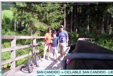
SAN CANDIDO -> CICLABILE SAN CANDIDO - LIEN