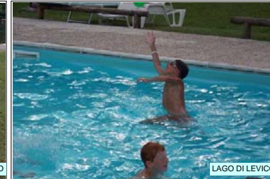
LAGO DI LEVICO